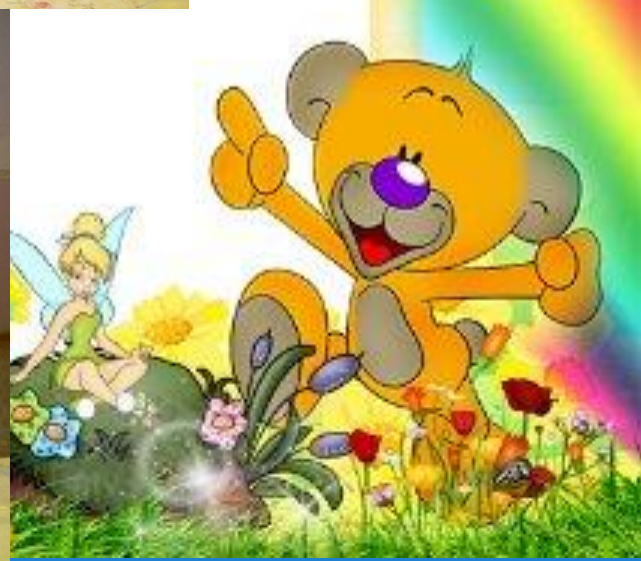
Физкультминутка - песня «Я на солнышке лежу»