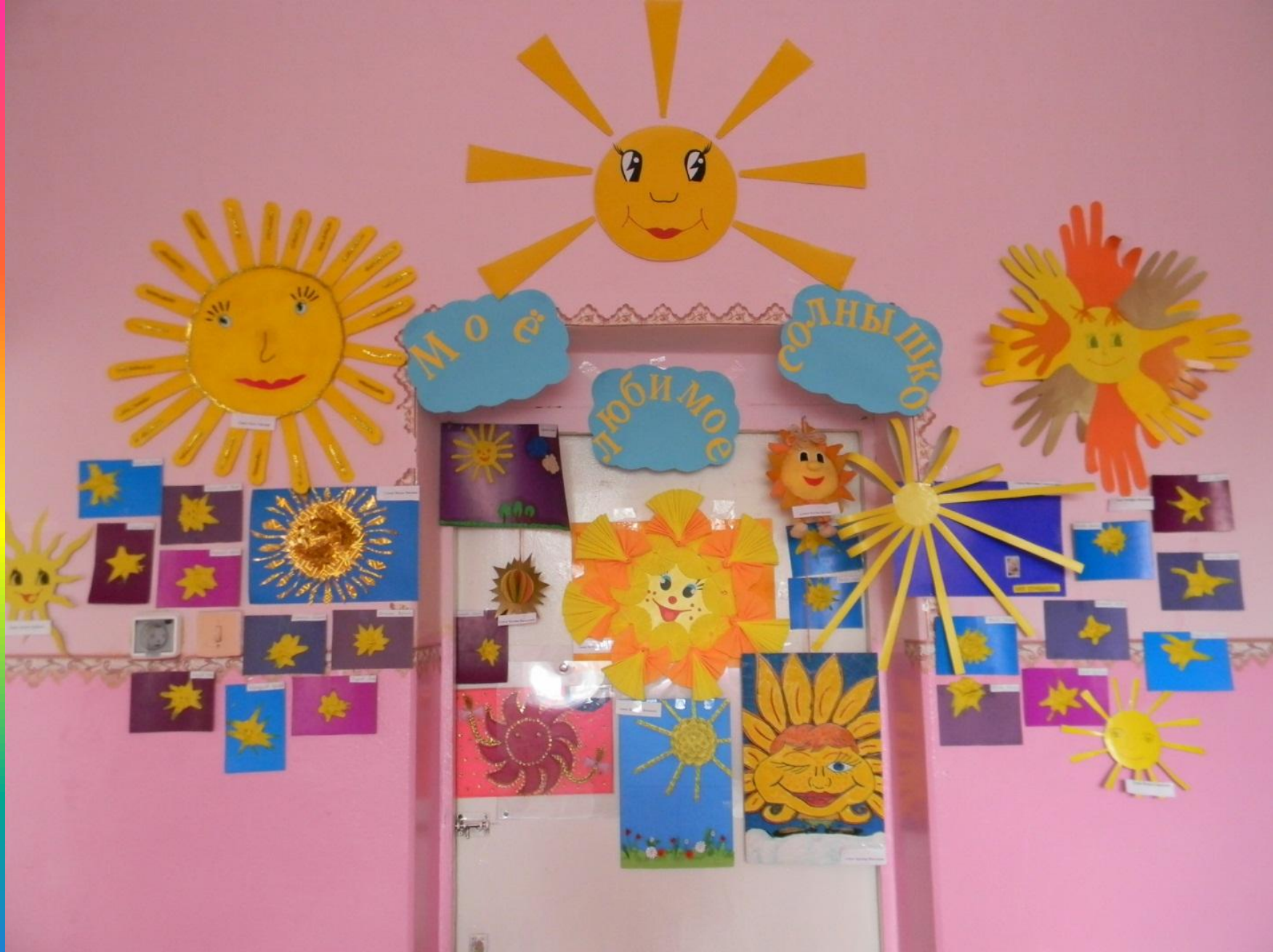
Совместное творчество детей и родителей