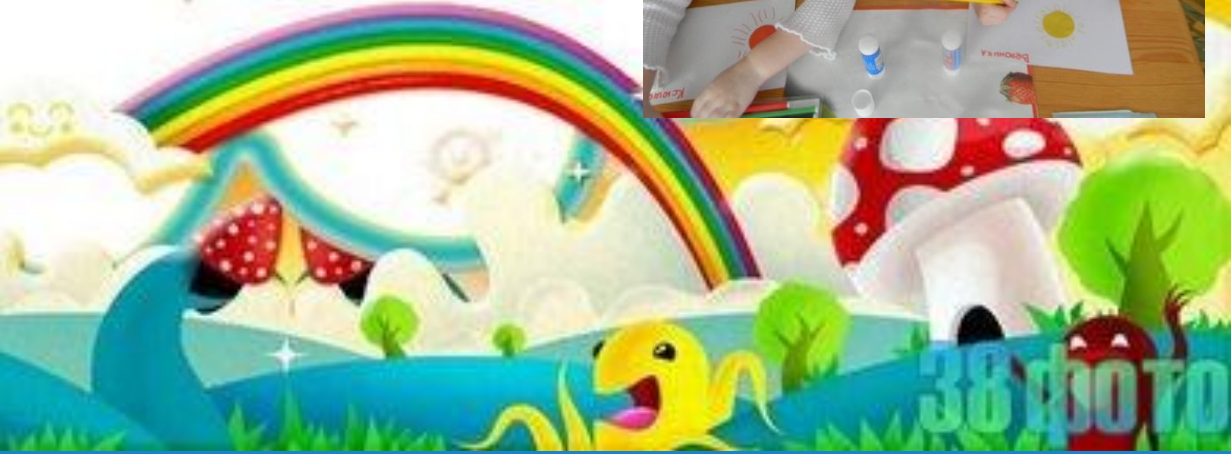
Аппликация с элементами рисования «Солнышко и облако»