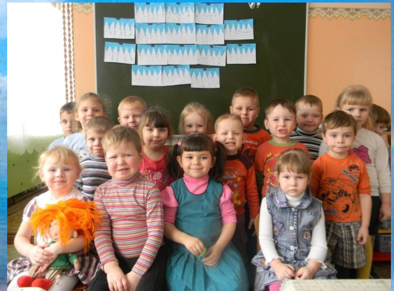
Рисование на тему: «Весенняя капель»