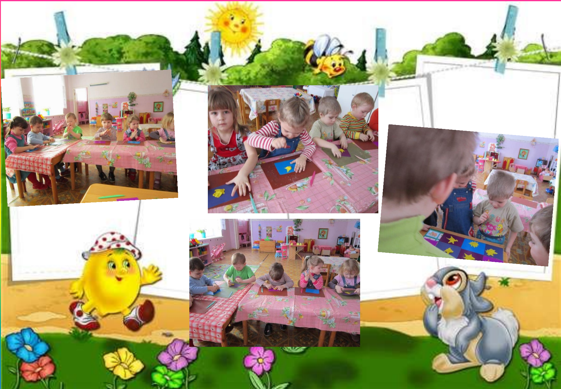
Лепка на тему: «Солнышко»