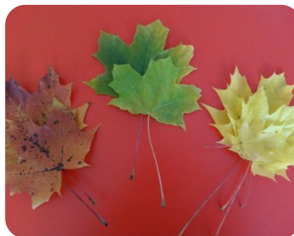
Желтый, красный, зеленый