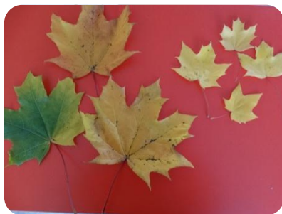
Большие и маленькие

На развитие познавательного интереса у детей предлагаю выполнить с детьми следующие задания: