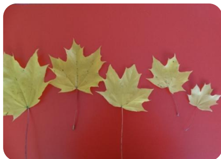
От большого к маленькому