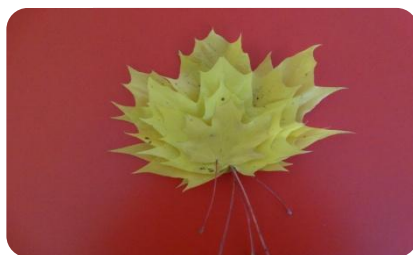
Ну чем не пирамидка?