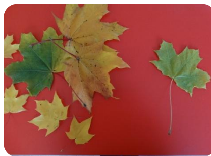
Один и много